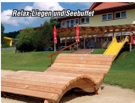
Relax-Liegen und Seebuffet