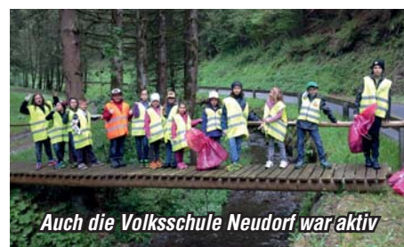
Auch die Volksschule Neudorf war aktiv