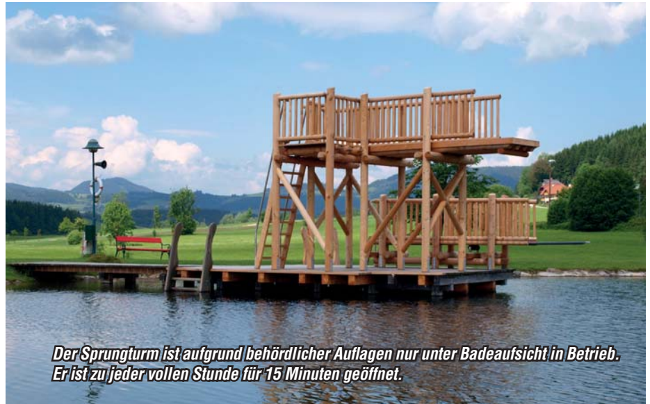
Der Sprungturm ist aufgrund behördlicher Auflagen nur unter Badeaufsicht in Betrieb. Er ist zu jeder vollen Stunde für 15 Minuten geöffnet.