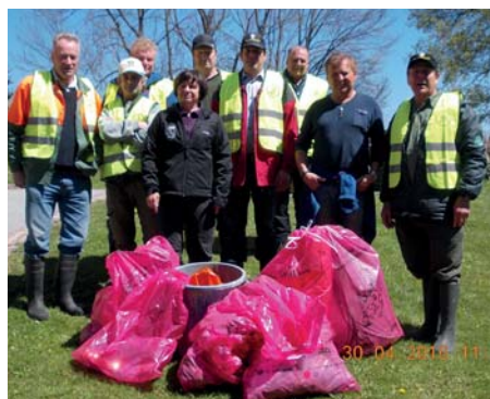
Die Berg- und Naturwacht war auch am Aktionstag in Passail/Hohenau vertreten.

Der Spruch der Berg- und Naturwacht „schützen - pflegen - erhalten und bewahren“ trifft vor allem im Frühjahrsputz Aktionszeitraum zu. Heuer folgten dem Aufruf der Bergwacht in Arzberg wieder Vertreter von Jagdverein, ÖKB, Volksschule und Sportverein und sammelten eine große Menge Abfall. Wir bedanken uns bei allen Teilnehmern.