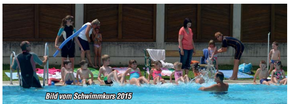
Bild vom Schwimmkurs 2015