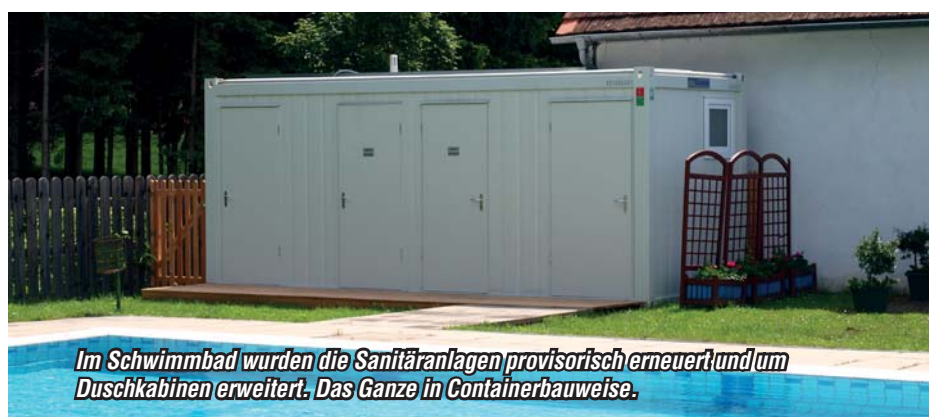
Im Schwimmbad wurden die Sanitäranlagen provisorisch erneuert und um Duschkabinen erweitert. Das Ganze in Containerbauweise.

Auch heuer wird es im Passailer Freibad wieder einen Schwimmkurs für Kinder geben. Gleich in der ersten Ferienwoche wird die Wasserrettung Voitsberg mit den Kids auf spielerische und lustige Art und Weise das Schwimmen üben. Anmeldungen und Informationen zum Schwimmkurs erhalten Sie direkt bei Maria Pretterhofer im Freibad Passail oder unter 0664/4250717. Der Schwimmkurs kostet € 100,00 pro Teilnehmer.