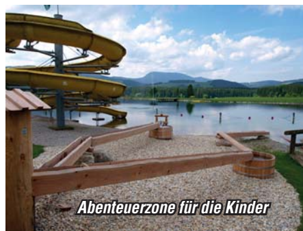
Abenteuerzone für die Kinder