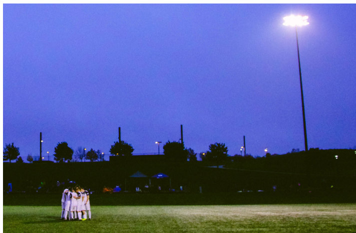
Künftig sind in Passail auch Abendspiele möglich

Dieser Beschluss wurde einstimmig gefasst.