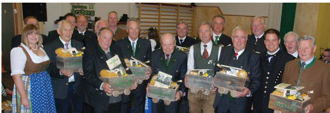
Alle Ehrenzeichenträger der Altgemeinde Arzberg erhielten ein Geschenk

Wir bedanken uns bei allen Beteiligten für eine dem Anlass entsprechend tolle Jubiläumsveranstaltung.