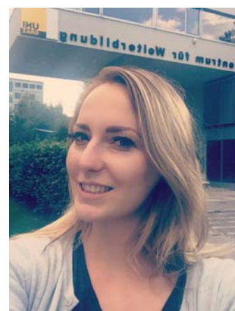
Ein Selfie vor der Uni

Das Antragsformular finden Sie auf passail.at unter „Förderungen“. ■