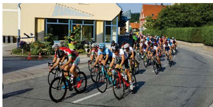
Kurz vor der Sprintwertung beim Cafe Niederl