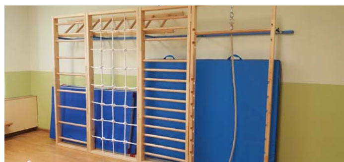
Im Kindergarten und der Kinderkrippe Passail wurden mehrere Kleinigkeiten verbessert und einiges angekauft. Z.B.: Sprossenwand, Markise, uvm.