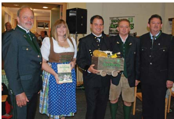
LH-Stv. Mag. Schickhofer bekam natürlich auch ein Gastgeschenk...