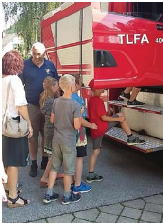
Besuch der VS Passail

4. Klassen der Volksschule Passail die Freiwillige Feuerwehr Passail besucht und einen Einblick in die Aufgaben rund um das Feuerwehrwesen gewinnen können. Die Mädchen und Jungen waren sehr interessiert und hatten großen Spaß daran, aktiv mitzuarbeiten.