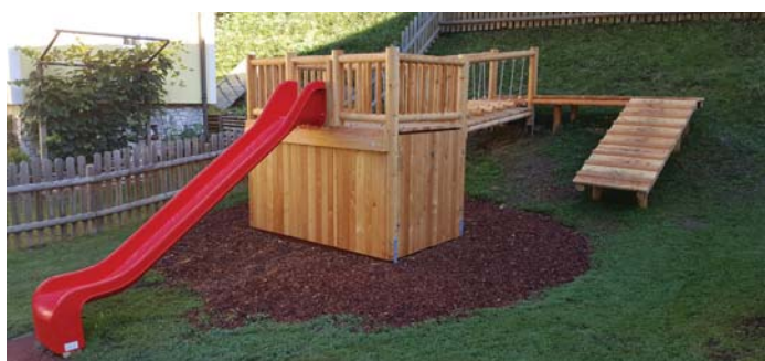
Für den Kindergarten Arzberg wurden neue Spielgeräte im Außenbereich angekauft, eine Markise installiert und eine Akustikdecke neu gemacht.