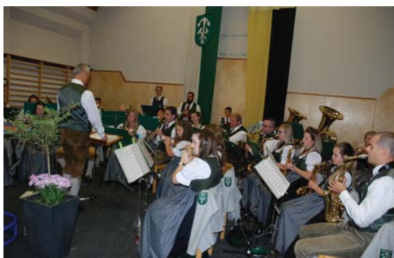
Der Musikverein Arzberg darf bei einem solchen Anlass natürlich auch nicht fehlen