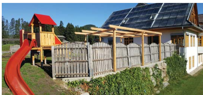
Im Kindergarten Hohenau wurde im Außenbereich viel Neues geschaffen und bestehendes saniert. Im Inneren wurde neu ausgemalt. Zwei Durchbrüche (Turnraum/neue Terrasse) wurden ebenfalls gemacht.