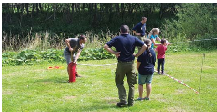
Bei der FF Plenzengreith war Pumpen angesagt