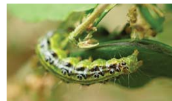
Der Buchsbaumzünsler war heuer stark verbreitet

punkt (ca.) der beabsichtigten Verbrennung