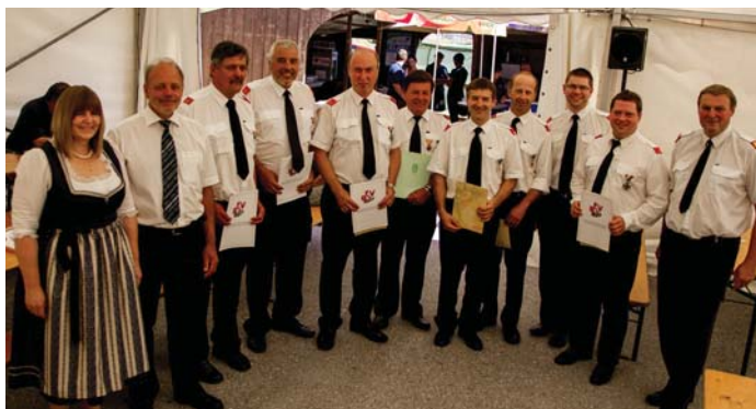
Auszeichnungsempfänger beim Neudorfer Fest

Die Freiwillige Feuerwehr Passail möchte sich nochmal bei allen ausgezeichneten Kameraden für ihre Verdienste um das Feuerwehrwesen in den vielen geleisteten Jahren bedanken!