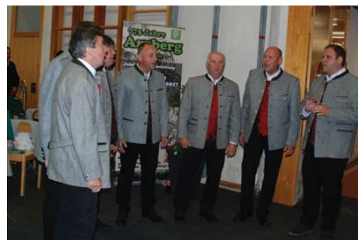
Die „Stimmen aus Arzberg“ sorgten für die musikalische Umrahmung der Feier