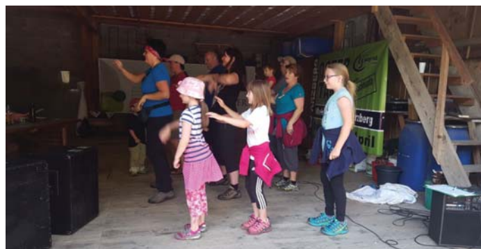
Die Arzberger Landjugend agierte als Tanzjury