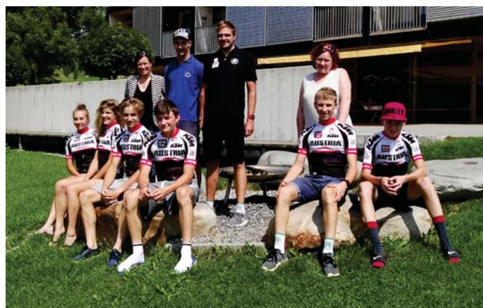
MTB Mix-Team Austria im Freizeitcamp Passail

Die Rad-Jugendtour war für unsere Gemeinde und unsere Region ein tolles sportliches Ereignis und eine großartige Werbung. Wir versuchen uns auch im nächsten Jahr als Etappenort zu bewerben.