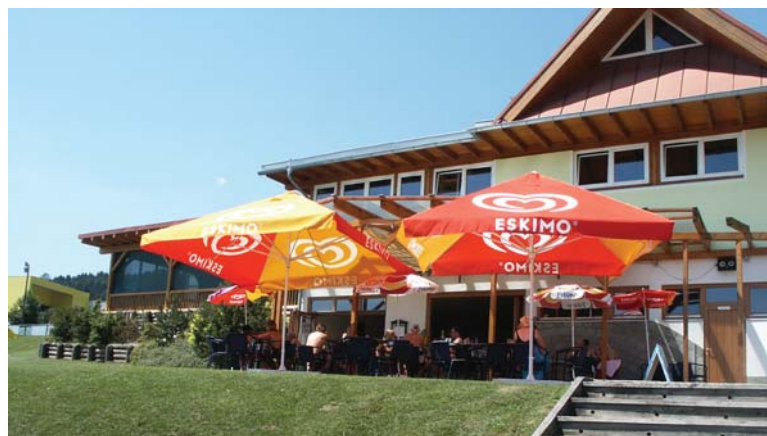
Vielen Dank, dass wir auf euch zählen konnten!