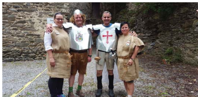
Die Gemeinderäte testeten Geschick und Orientierung bei der Burg Stubegg