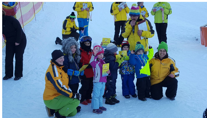
Kindergärten Hohenau & Arzberg

Fast allen ist es nach dem einwöchigen Kurs der Schischule Eder möglich, alleine auf Ski zu stehen. Ein Dank gilt den vielen Begleitpersonen und Eltern die unterstützend vor Ort waren. ■