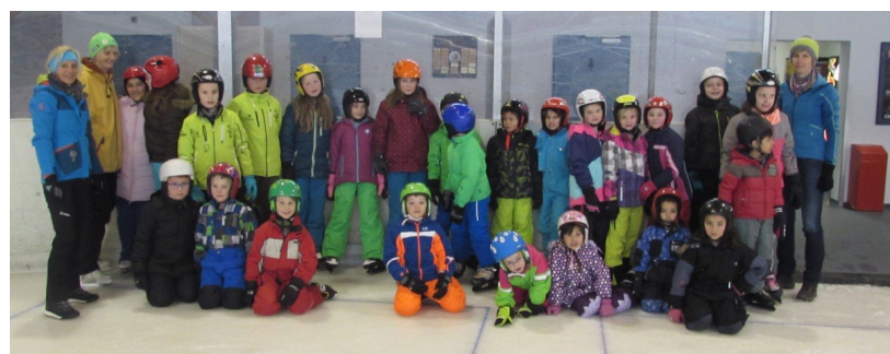
Auch das Eislaufen in der Weizer Eishalle hat allen großen Spaß gemacht.

le Arzberg über einen Schüler/innenzuwachs, es kommt eine Klasse dazu.