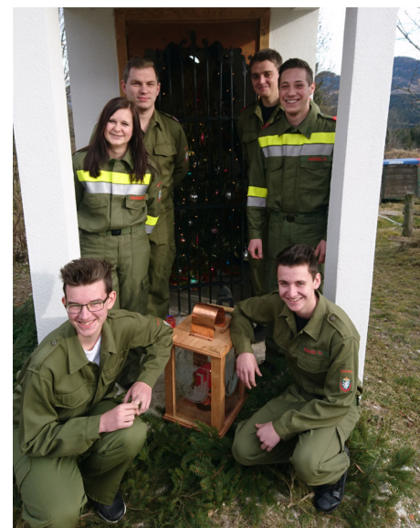
Friedenslicht der Feuerwehrjugend Neudorf