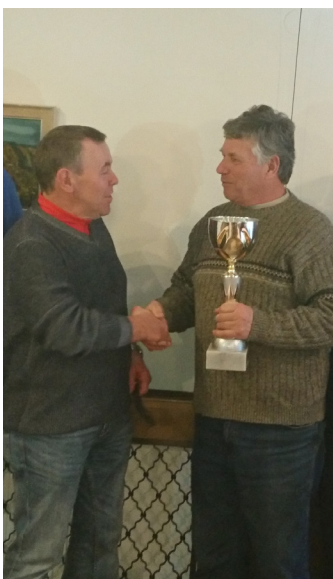
Sieg im Eisschießen gegen die FF Semriach