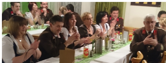
Ball der FF Neudorf, Gasthaus Angerwirt Kappel