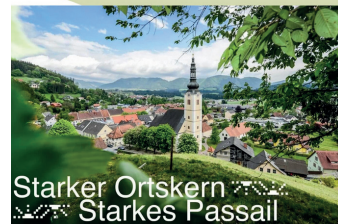
Starker Ortskern Starkes Passail