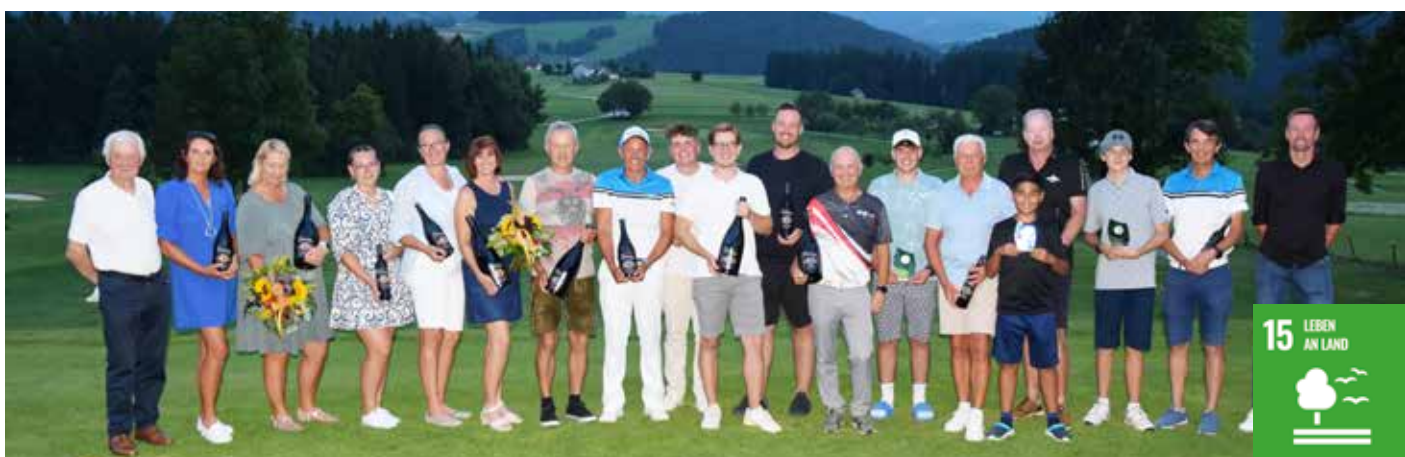
Die Sieger bei den Clubmeisterschaften 2024