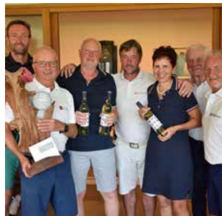
Siegergemeinde Thannhausen bei der Gemeinde Trophy 2024