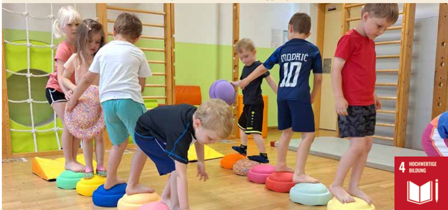
Der Teamspirit steht im Vordergrund.

Ich sehe die unterschiedlichen Vorlieben sowie Stärken jeder einzelnen Kollegin als große Bereicherung für unsere Bildungsarbeit. Ebenso stolz machen mich die Kinder, die in ihrer Kinderkrippen- sowie Kindergartenzeit zu proaktiven, selbstständigen und selbstbewussten Kindern heranwachsen.