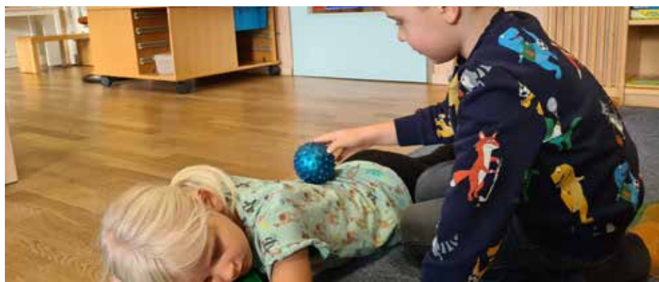
Ich lerne, was mir gut tut.

Das Team der Kinderkrippe und des Kindergartens Passail