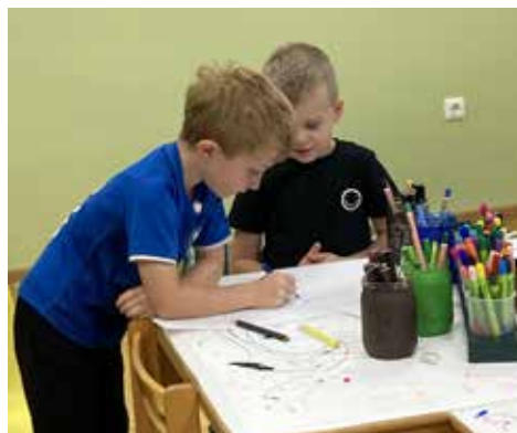
Miteinander geht es besser! Gemeinsam leben, wachsen, lernen.