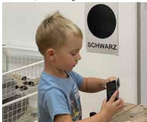
Ich habe einen Plan.